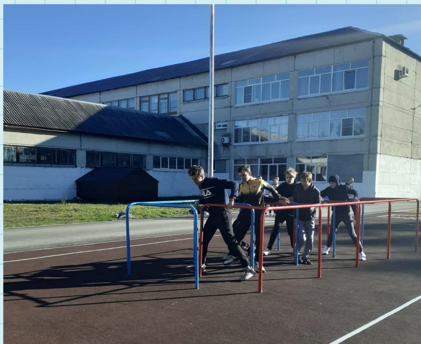
На фото сборная команда школы № 44

Командам предстояло собрать и разобрать автомат на время, снарядить магазин патронами, метать гранаты, пробежать армейскую полосу препятствий, попасть в мишень из пневматической винтовки и преодолеть верёвочную переправу. Уделили внимание и мозговому штурму, в котором участники должны были отвечать на вопросы.