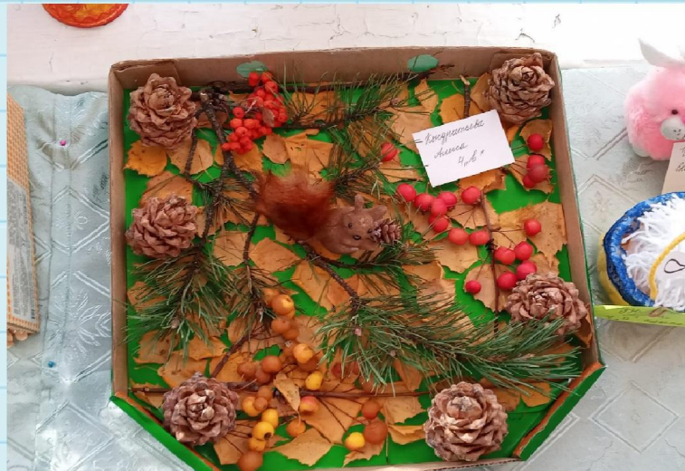
Фото и материал подготовили Власенко Ульяна, Никитенко Каролина

"Умелец да рукодельник и себе и людям радость приносит".